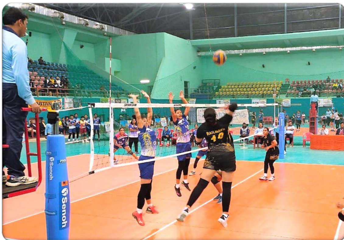
A Moment of action during women semifinal match between Railways and West Bengal