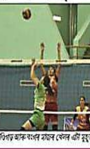
চণ্ডীগড় আৰু বংগৰ মাজৰ খেলৰ এটা মুহূৰ্ত

গুৱাহাটী, ৭ ফেব্ৰুৱাৰী। গুৱাহাটীত অনুষ্ঠিত ৭১তম ছিনিয়ৰ ৰাষ্ট্ৰীয় ভলীবল প্ৰতিযোগিতাৰ মহিলা শাখাৰ কোবাৰ্টাল ফাইনেলত প্ৰবেশ কৰিছে কেৰালা, পশ্চিম বংগ আৰু ৰাজস্থান। সৰুসজী ইন্ড'ৰ ষ্টেডিয়ামত প্ৰতিযোগিতাখনৰ আদি পুৰুষ আৰু মহিলাৰ কোবাৰ্টাল ফাইনেল অনুষ্ঠিত হয়। মহিলাৰ প্ৰথমখন কোবাৰ্টাল ফাইনেলত কেৰালাই ৩-০ (২৫-১৪, ২৫-১৭, ২৫-১৫)ৰ ব্যবধানত হাৰিয়ানাৰ পৰা পৰাস্ত কৰি ছেমি ফাইনেলত স্থান