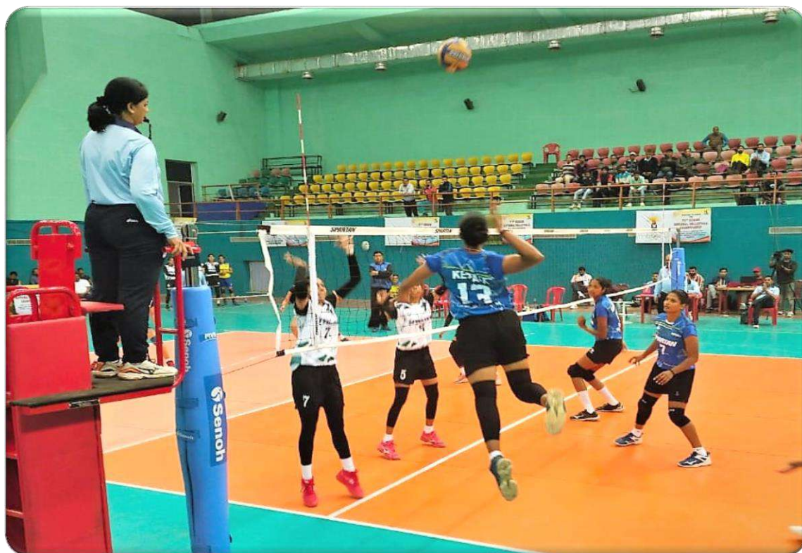
A Moment of action during women semifinal match between Railways and West Bengal