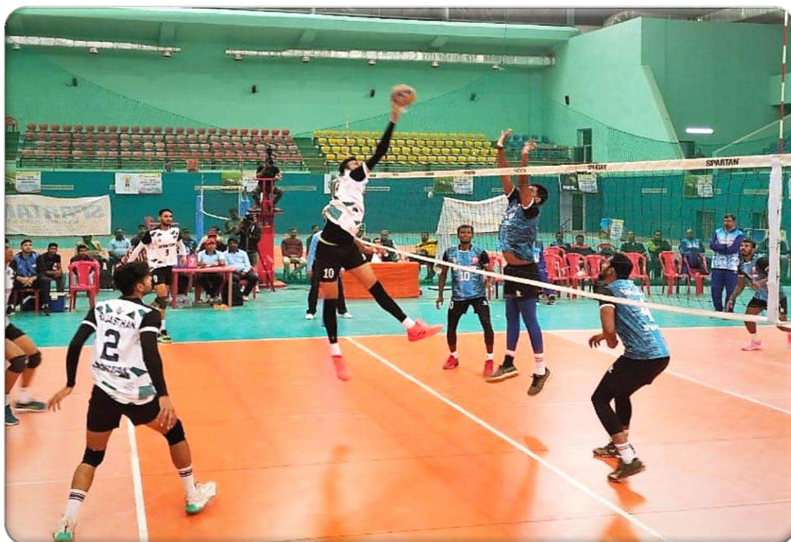
A Moment of action during men semifinal match between Rajasthan and Tamil Nadu