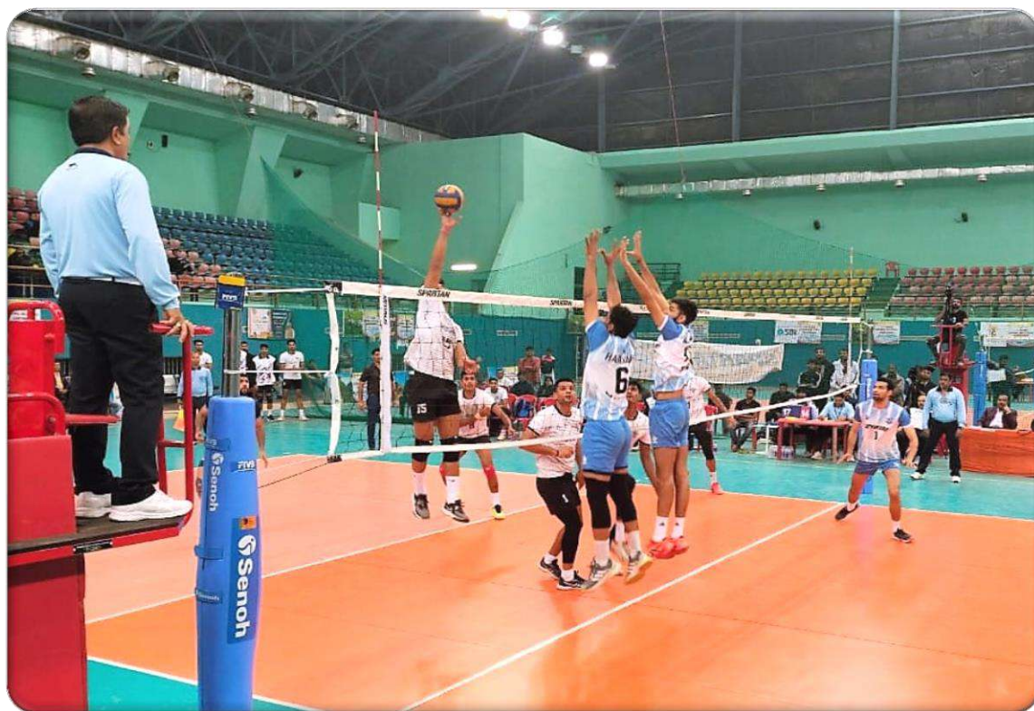
A Moment of action during men semifinal match between Services and Haryana