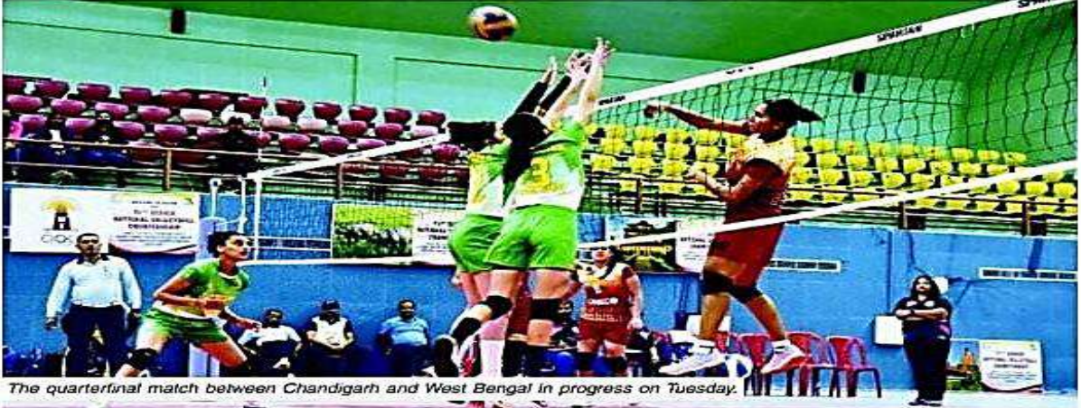
The quarterfinal match between Chandigarh and West Bengal in progress on Tuesday.